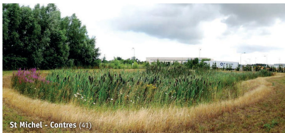
St Michel - Contres (41)